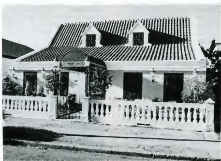
Un invershon cu ta bale la pena pa Aruba

Nos ta leu ainda di bon caminda: Bo por imagina bo con un hotel di 6 piso lo keda meimei di tur e edifisianan abou, cu ta rondoná e lugá caminda antes nos warda di polis tawata pará?